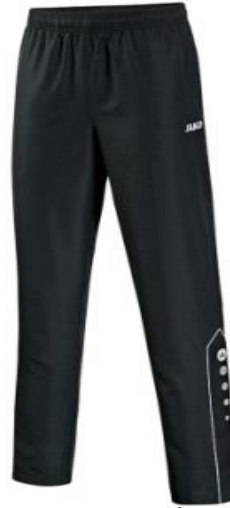
Präsentationshose Lang 25,00€