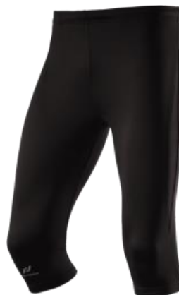
athletic Tight \frac{3}{4} 25,00€