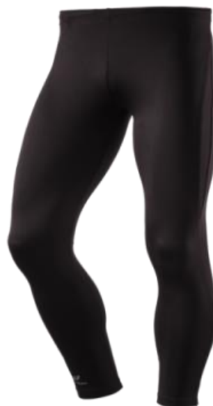
athletic Tight lang 28,00€