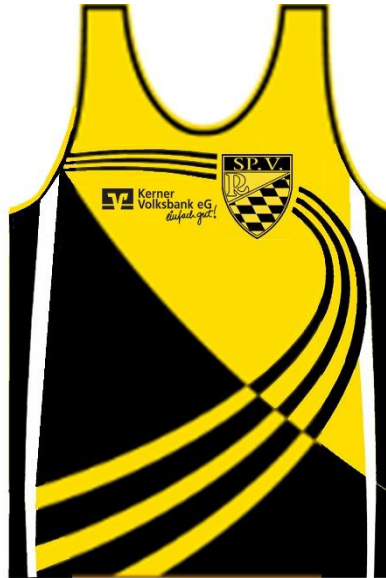
athletic Singlet 15,00€