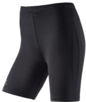
athletic Tight kurz 25,00€