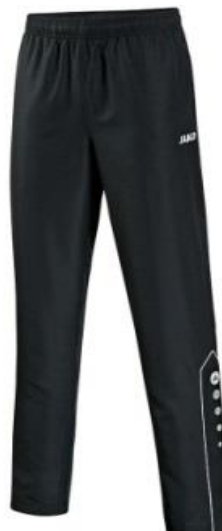
Präsentationshose Lang 20,00€