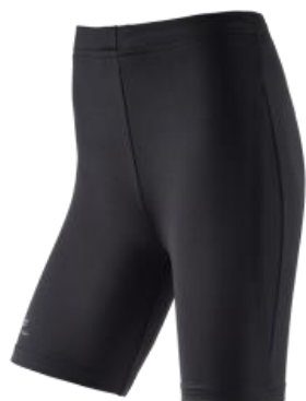
athletic Tight kurz 20,00€