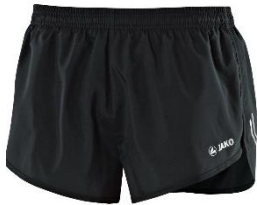
Sprinterhose (nur Herren) 25,00€